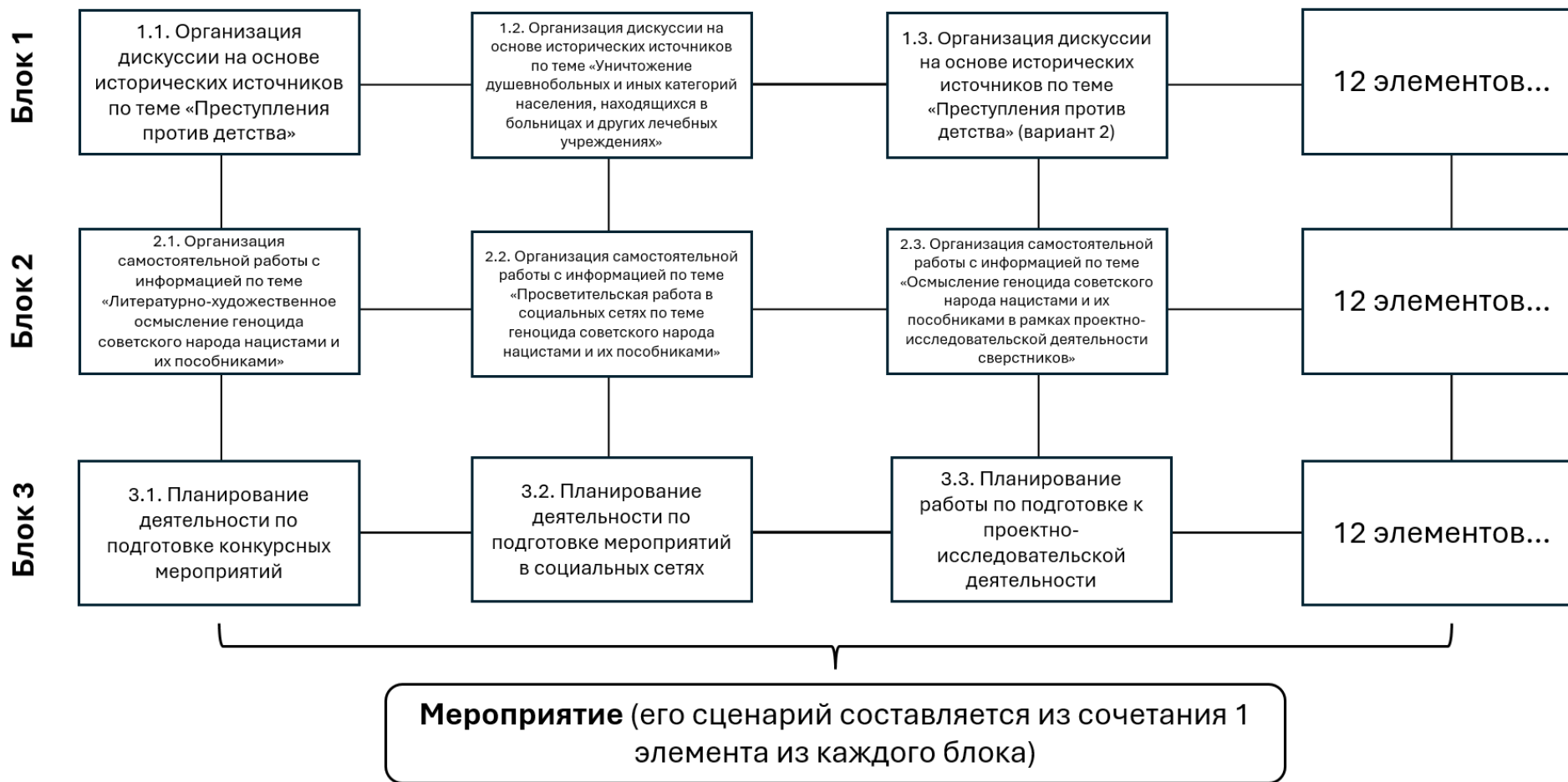
Рисунок 2. Структура методического конструктора